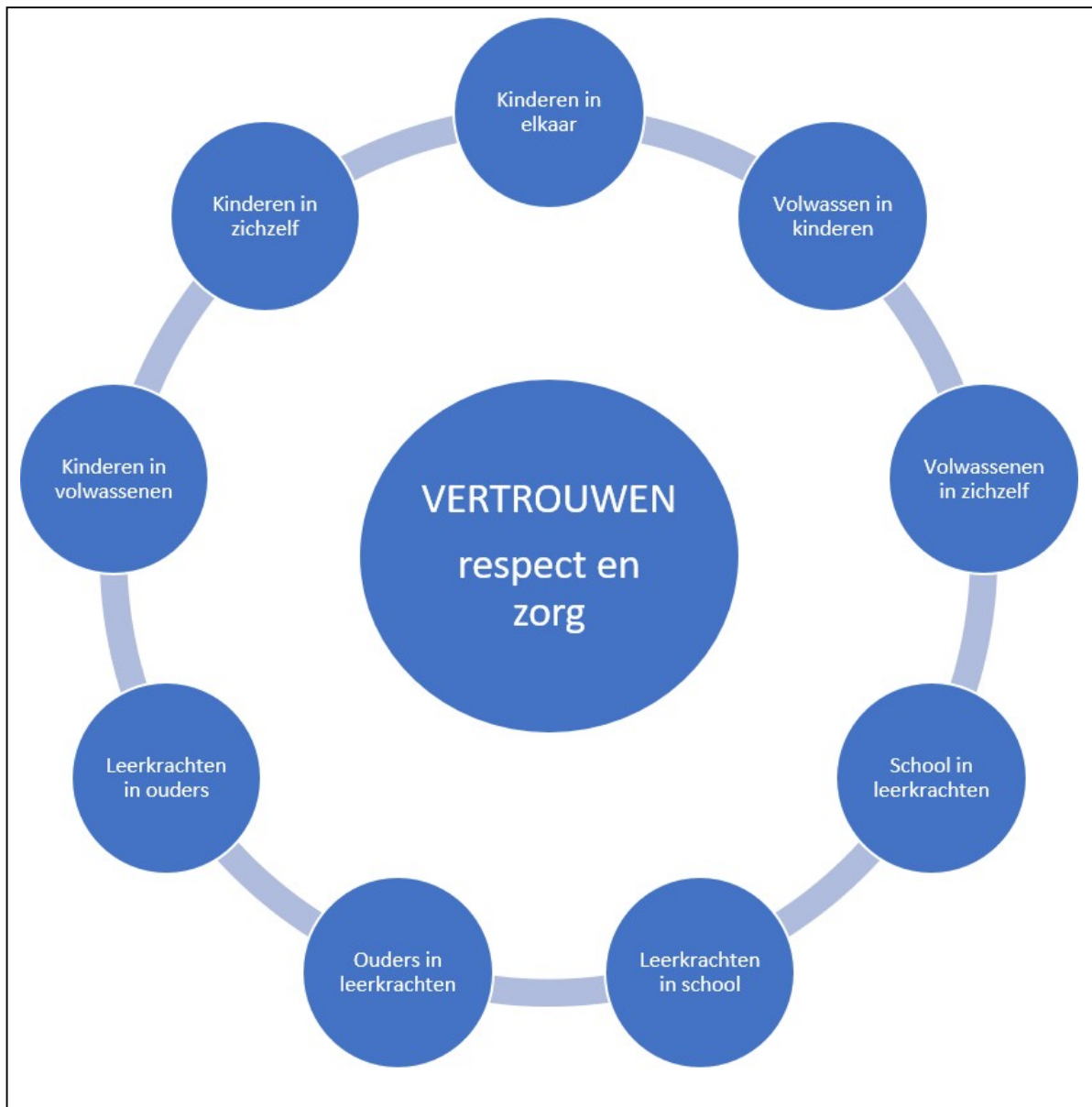
Figuur 1: Een basiskader van VERTROUWEN, RESPECT en ZORG

verbinding school maken zelf ook weer het respect, vertrouwen en de zorg voor elkaar (zie figuur 1).