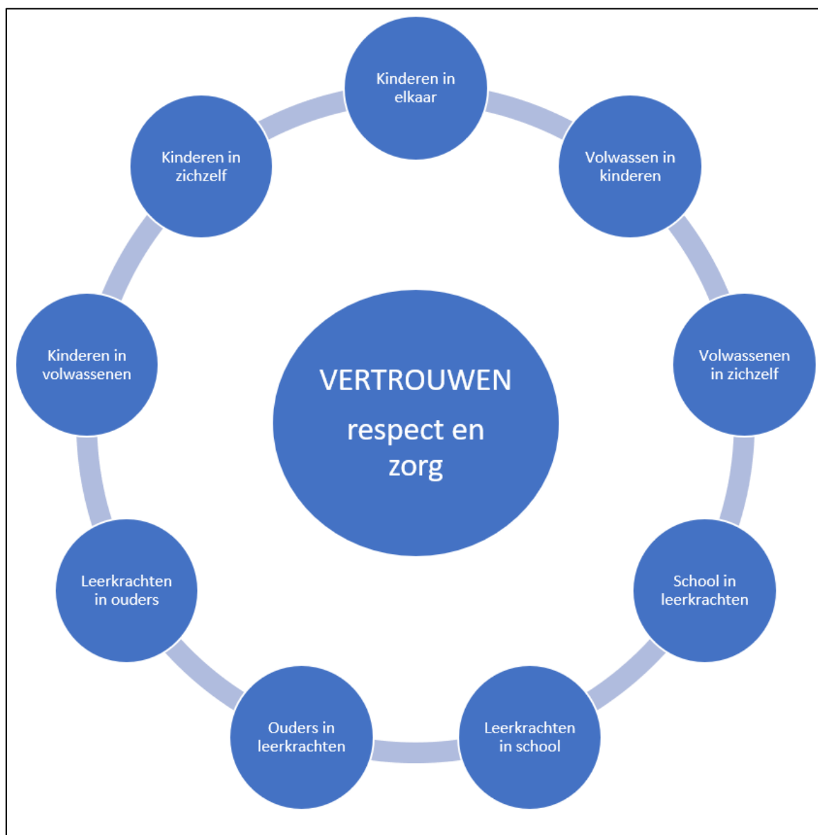
Figuur 1: Een basiskader van VERTROUWEN, RESPECT en ZORG

De school doet van haar kant het maximale om een verbindend kader te creëren, met respect, vertrouwen en zorg, maar verwacht hierin ook een wederzijdsheid van de ouders. Dit betekent dat we: